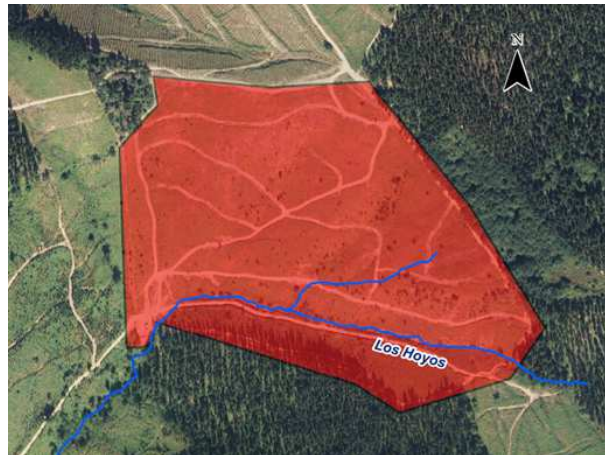
Ilustración 1: Ubicación.

La parcela objeto del Plan Especial se ubica dentro de la Demarcación Hidrográfica del Cantábrico Oriental, dentro de la Unidad Hidrológica Ibaizabal. El ámbito es atravesado por dos escorrentías: el arroyo Los Hoyos y una escorrentía tributaria al citado arroyo (ver Ilustración 1).